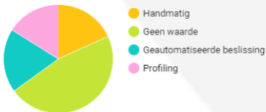
Toelichting Grafiek met Soorten verwerking van actieve verwerkingen