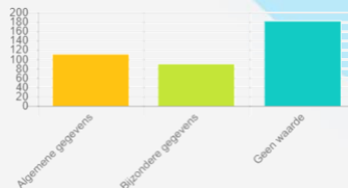
Toelichting Grafiek met Categorieën persoonsgegevens verwerkingen*