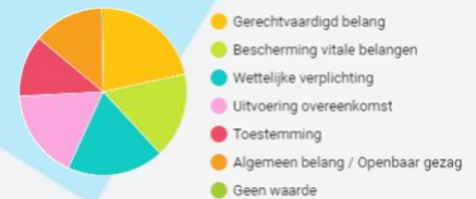
Toelichting Grafiek met Grondslag voor actieve verwerkingen

Privacy én daarmee de veiligheid van de gegevens die instanties verzamelen en verwerken zijn essentieel voor de bedrijfsvoering. Of dat nu het gevolg is van het van kracht worden van de Algemene Verordening Gegevensbescherming (AVG/GDPR) of (zelf)opgelegde normering zoals de ISO 27001 (of daarvan afgeleide normen zoals NEN7510 of BIO), falen op het werkkterrein privacy is vandaag de dag geen optie.